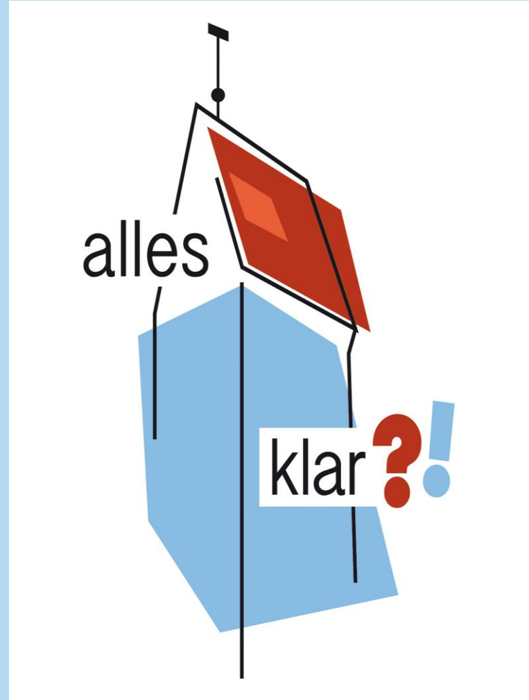
Fundraisingpreis Kommunikation Gewinnerin: Ev. Luth. Kirchengemeinde Küchnitz