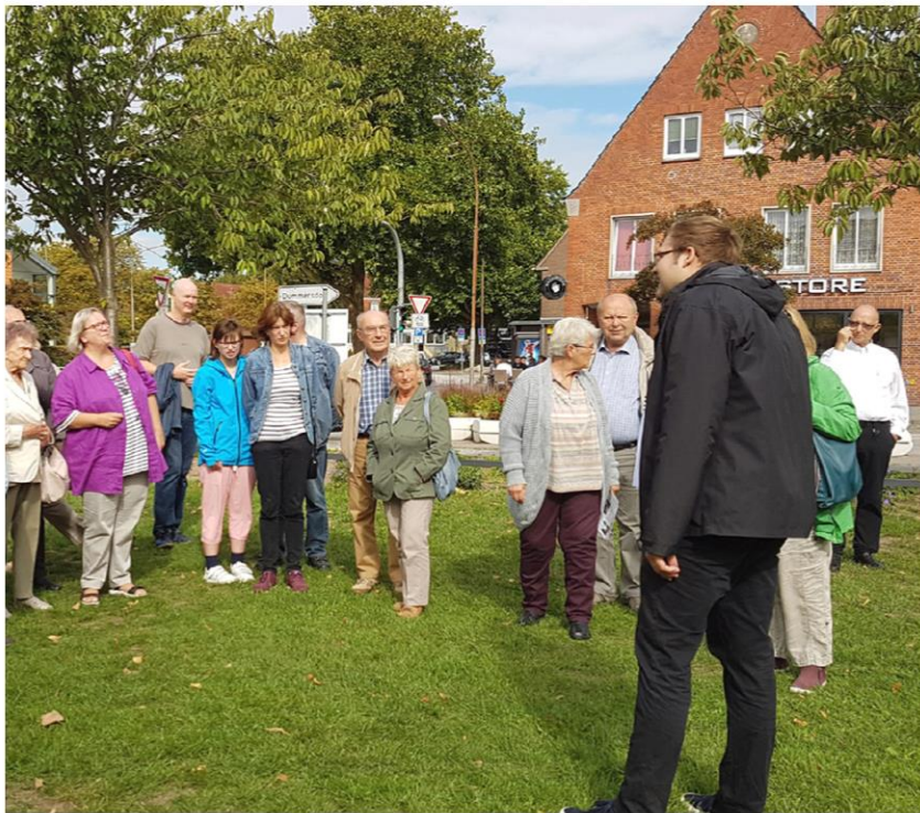
Tag des Denkmals